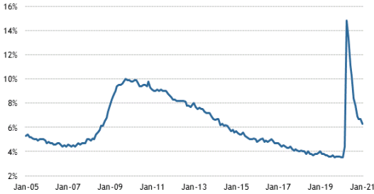
Unemployment Rate (SA)

Source: Bureau of Labor Statistics; updated 02/05/21